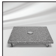
M4 granitfod med hjul