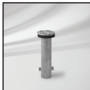
M4 monteringsrør til nedstøbning