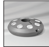
Lampe med 8 lys