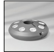
Lampe med 8 lys