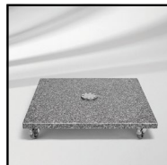
M4 granitfod med hjul