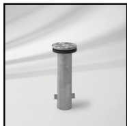
M4 monteringsrør til nedstøbning