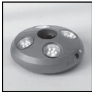
Lampe med 4 lys