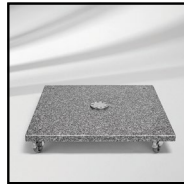
M4 granitfod med hjul