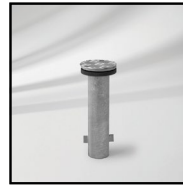
M4 monteringsrør til nedstøbning